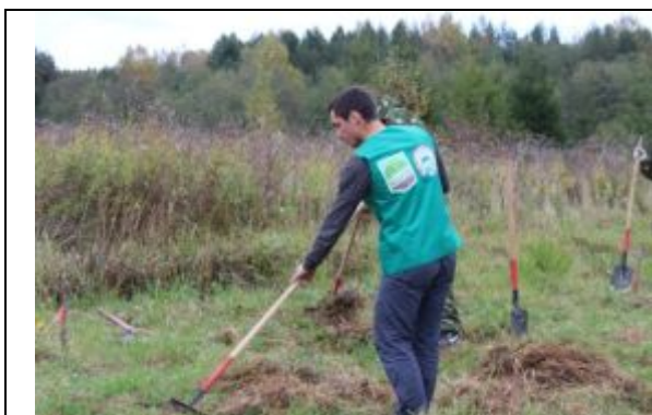
Рис.4.2.2. Уборка скошенной травы