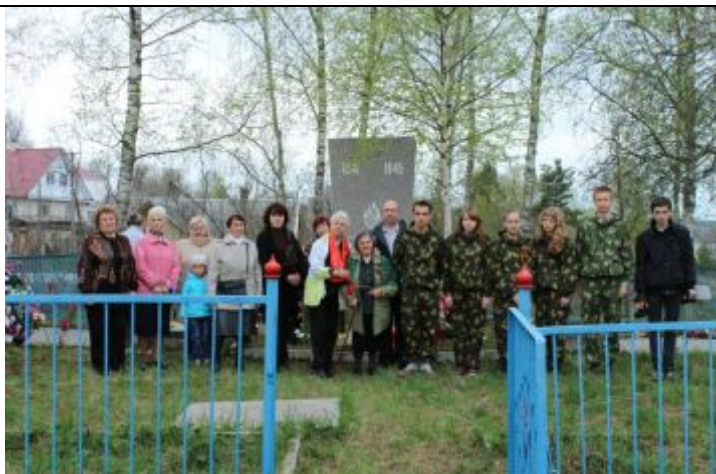
Рис. 1. Митинг у братских захоронений 9 мая