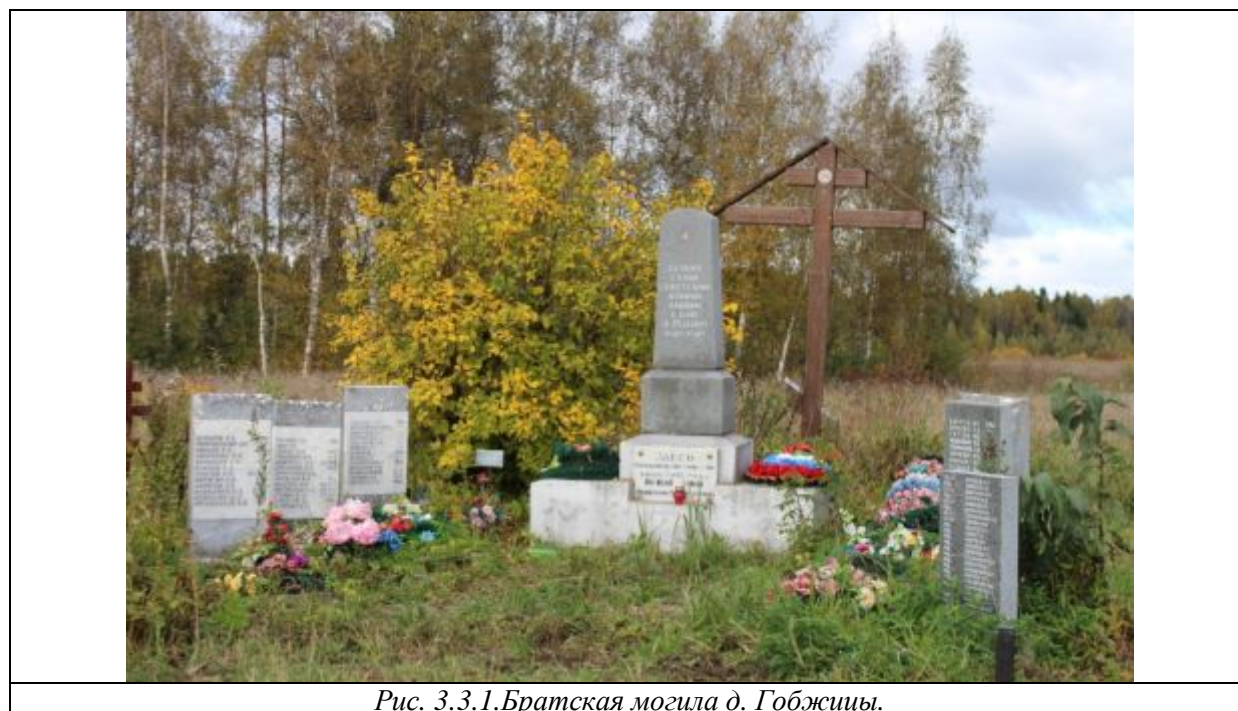
Рис. 3.3.1. Братская могила д. Гобжицы.

Дата внесения в Книгу Памяти: 16.02.2012