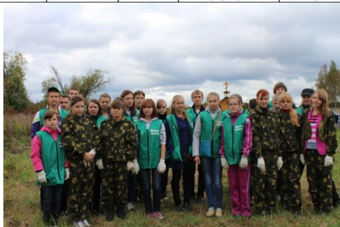
Рис. 4. 2. 1. Команда проекта