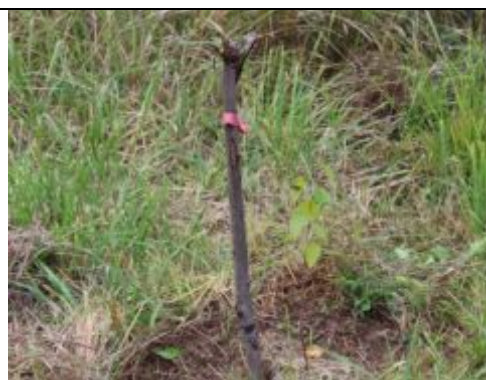
Рис. 4.2.2 Посадки березы