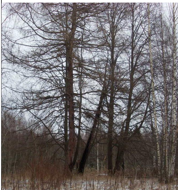
Рис. 2.5.2. Лиственницы, посаженные жителями д. Далёково