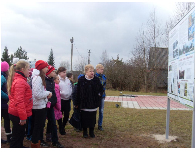
Рис. 4.4.2. Экскурсия в историко-культурном центре п. Калитино

1. Побывали на экскурсии в историко-культурном центре п. Калитино Волосовского района. В результате экскурсии мы узнали подробности трагедии д. Большое Заречье (рис. 4.4.2).