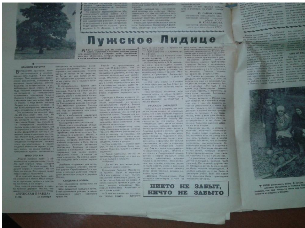
Рис. 2.1.2. Статья в газете «Лужская правда»