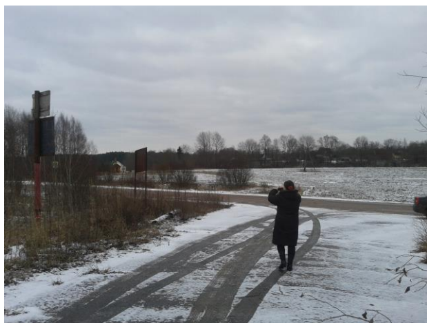
Рис. 2.5.3. Выбор места установки памятного знака