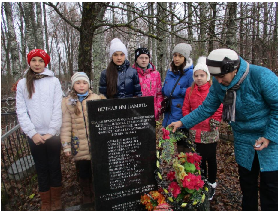
Рис. 2.1.1. Поездка на братское захоронение д. Смерди