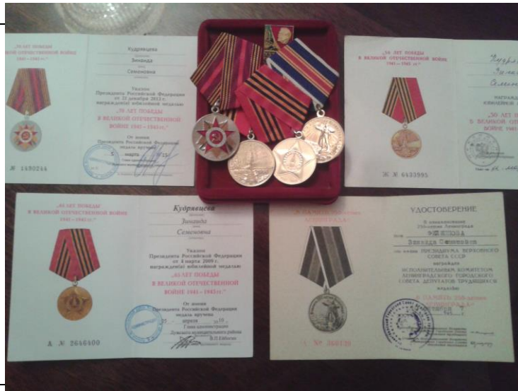
Рис. 4.4.7.3. Награды Филипповой В. С.

8. Встретились с краеведом Гатчинского района Андреем Бурлаковым, который интересуется темой сожженных деревень. Он поделился имеющейся информацией (приложение 4.4.8).