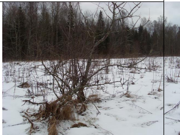
Рис. 2.5.4. Сохранившаяся яблоня в сожжённой деревне

Установка памятного знака и проложенный экскурсионный маршрут может стать традиционным маршрутом походов не только для школьников Лужского района, но и для любителей истории всей области. Наше участие в