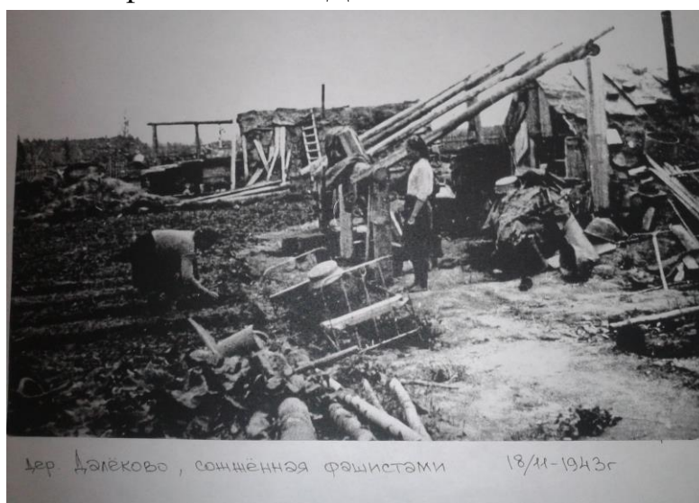
Рис. 1. Дер. Далёково, сожжённая фашистами

- согласование с местными властями возможности установки памятного знака о сожженной фашистами д. Далёково.