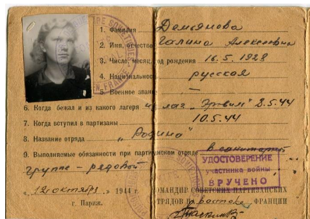
Рис.1.2. Удостоверение участника войны

Сроки и место исследования. Наша исследовательская работа началась с июня 2015 года и ведется по настоящее время в Толмачевском городском поселении.