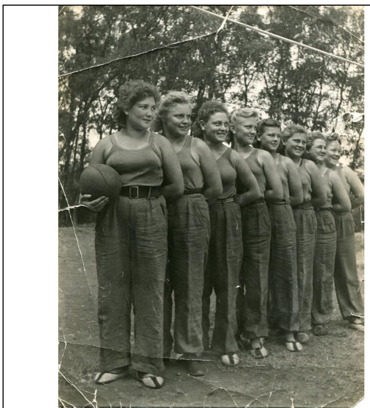
Рис.1.1. Фото Дружеский матч, Париж, 1945г