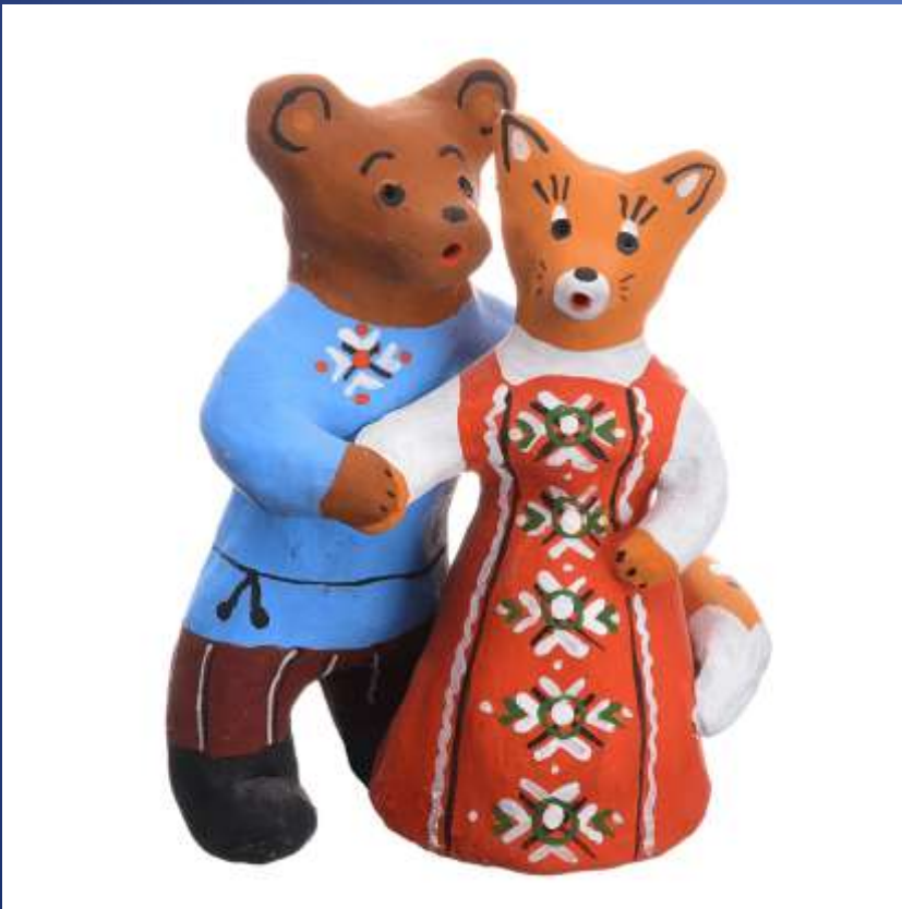
Каргопольская глиняная игрушка