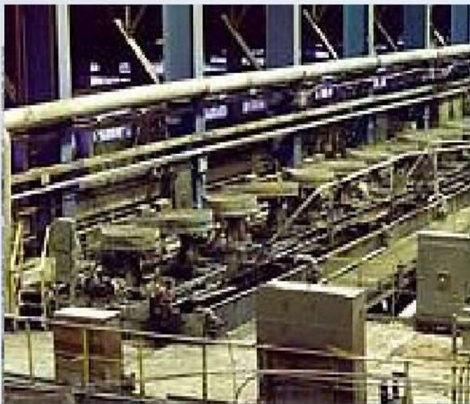
Производство апатитового концентрата